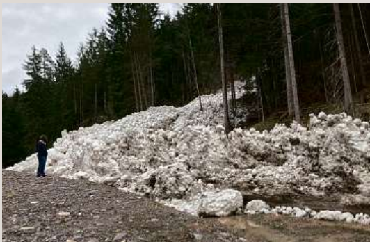
GRAUBÜNDEN ..... Seite 3