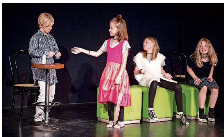
Alles marktfrisch und ohne Verfallsdatum: Die Kinder entwickeln Szenen und Geschichten direkt auf der Bühne.